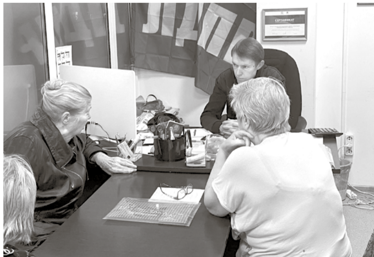
Прием в Таганрогском местном отделении партии.