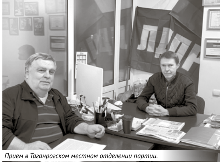
Прием в Таганрогском местном отделении партии.

по всей стране был организован очередной всероссийский прием граждан ЛДПР. Напомним