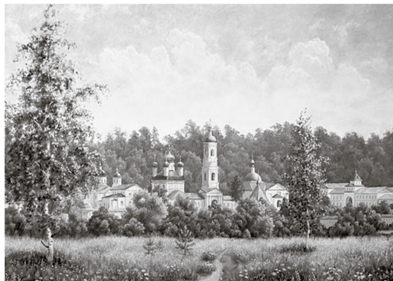
Художник Ирина Гайдук «Вид Оптиной пустыни».