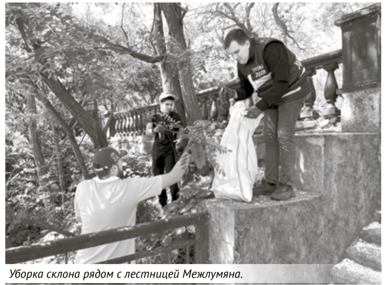
Уборка склона рядом с лестницей Межлумяна.