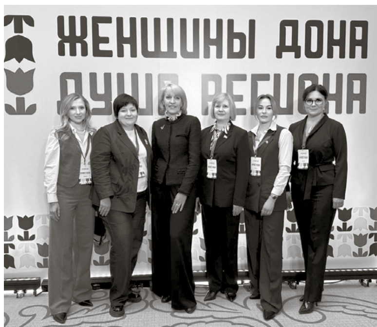
Делегация Таганрога на региональном женском форуме «Женщины Дона – душа региона» в городе Ростове-на-Дону.