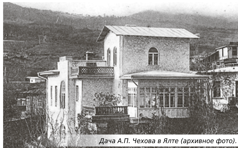
Дача А.П. Чехова в Ялте (архивное фото).

15 июля в Таганроге вспоминали Антона Павловича Чехова. Наш великий земляк ушел из жизни 119 лет назад, оставив нам в наследство бесценный дар – свое гениальное творчество. С именем Чехова в мире связано немало мест, но есть два особенных: Таганрог, где писатель появился на свет, и Ялта, где он провел последние шесть лет жизни.