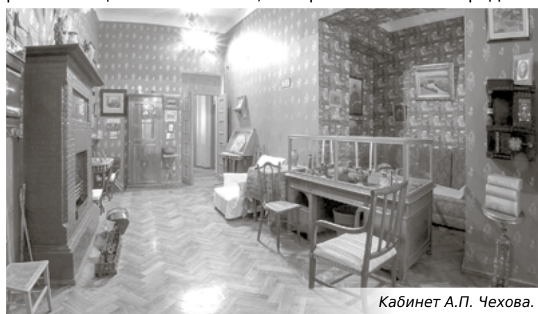
Кабинет А.П. Чехова.

Наши корреспонденты последовали этому совету и загадали желание вернуться на Белую дачу в будущем году. А пока с охапками чеховских цветов и приветов от ялтинских музейщиков отправились на родину писателя... И хотя путь домой был тернистым и долгим, нас окрыляли чеховские строки: «Если каждый человек на куске земли своей сделал бы все, что он может, как прекрасна была бы земля наша!».