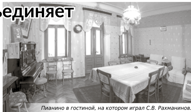
Пианино в гостиной, на котором играл С.В. Рахманинов.

...В 5 утра, когда читатели таланта еще спали крепким сном и не приставали с автографами, Антон Павлович надевал солнцезащитные очки, брал в руки секатор и отправлялся в сад. По воспоминаниям современников, он мог часами возиться с растениями: обрезать деревья и кустарники, поливать и высаживать