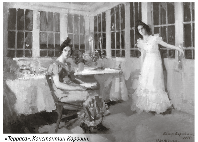
«Терраса». Константин Коровин.

Первыми увидели результаты трудов реставраторов жители и гости северной столицы, где весной экспонировалась выставка «Спасенные шедевры. Русский музей – Таганрогу». А летом произведения искусства вернулись в родные пенаты. Взглянуть на них можно, побывав в историческом здании Таганрогского художественного