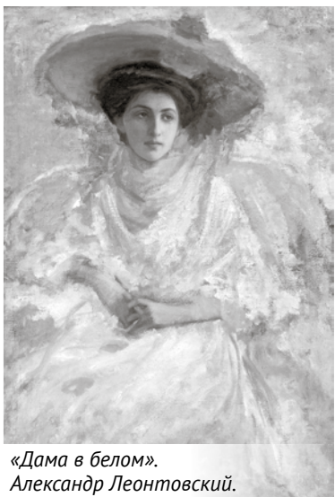
«Дама в белом». Александр Леонтовский.

«Спасенные шедевры. Русский музей – Таганрогу» – так называется уникальная выставка, открывшаяся в залах Таганрогского художественного музея.