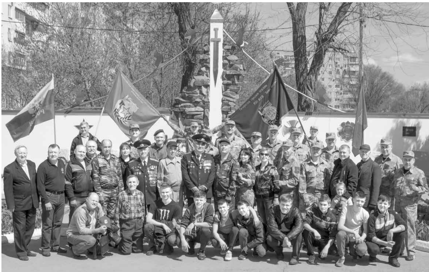
Встреча ветеранов, друзей и соратников «Боевого братства» у мемориала «Черный тюльпан».

Понятие «мир» перестало быть приоритетным для цивилизации. Локальные войны вспыхивают то здесь, то там, и, несмотря на мирную жизнь, где-то все равно идет война.